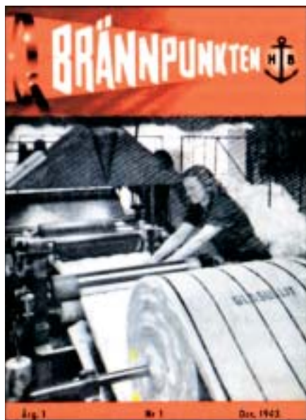
Omslagsbilden till första numret av Brännpunkten år 1943 visar en symaskin för glasullstillverkning.

I december 1943 utkom personaltidningen Brännpunkten med sitt första nummer. Sedan dess har omkring 290 nummer av tidningen tryckts och totalt har under dessa 60 år omkring en miljon exemplar av personaltidningen lämnat pressarna. Brännpunkten är om inte den äldsta, troligen den näst äldsta av de periodiska personaltidningar som idag utges i Sverige.